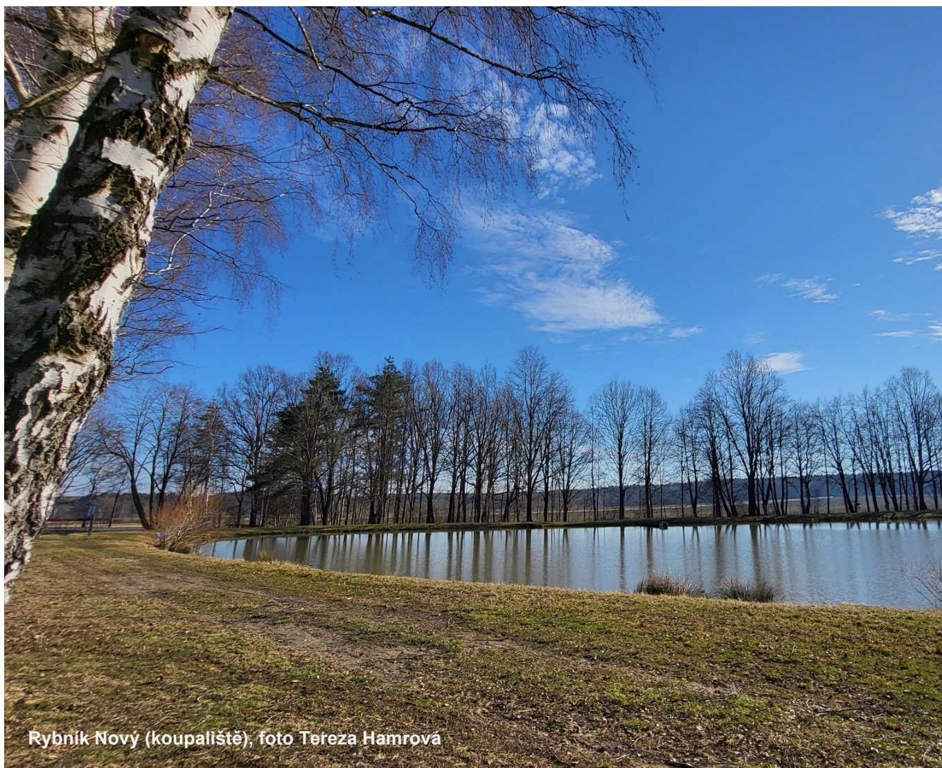
Rybník Nový (koupaliště)